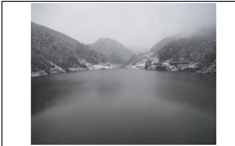
3 貯水池(ダムから上流)