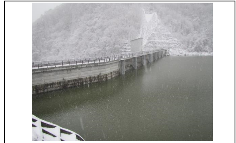
2 ダム上流面(左岸から)